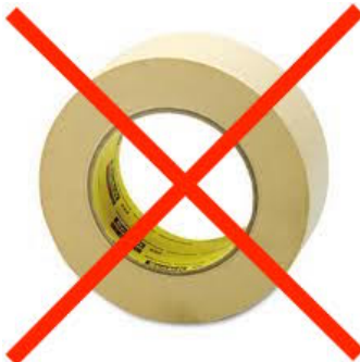
Ruban adhésif type carrossier