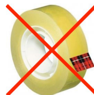
Ruban adhésif type Scotch